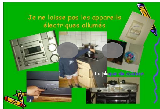
Exemples de diapositives du Power Point du groupe des "jeunes enfants"