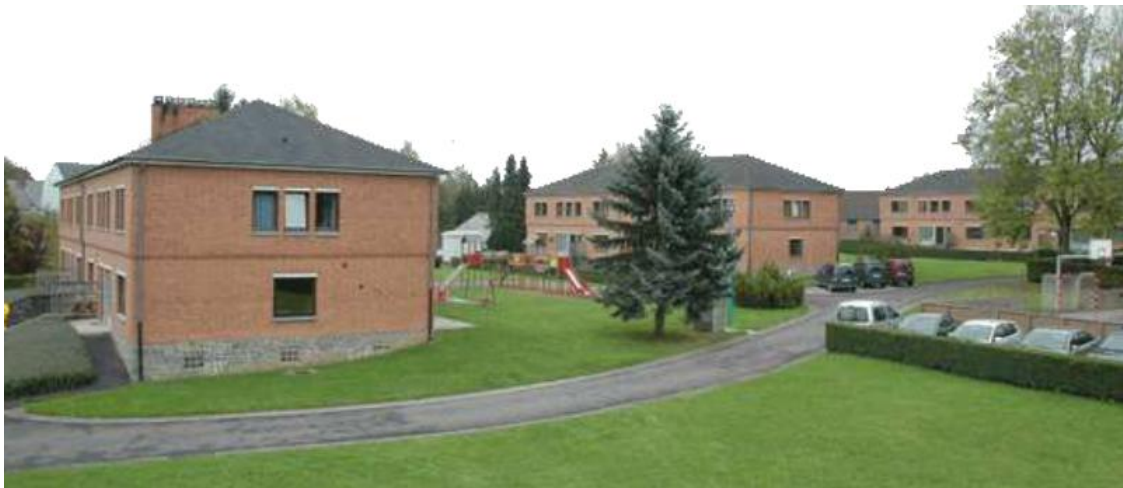
Le Clos du Chemin Vert asbl